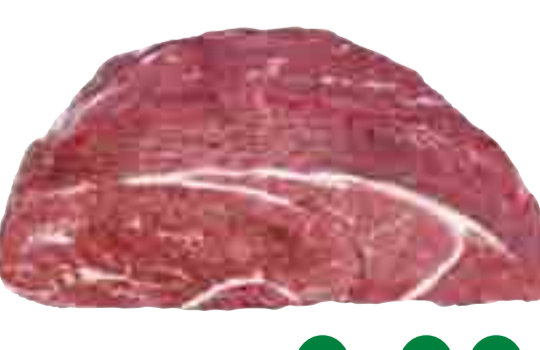
Rinder-Braten Hochrippe 9.99 l kg