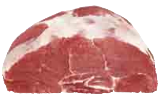
Rinder-Wade 9.99 l kg