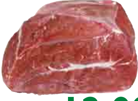
Rinder-Braten vom Bug 12.99 l kg