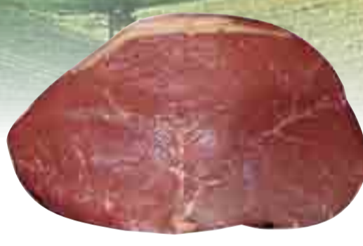
Rinder-Hüfte 22.99 l kg