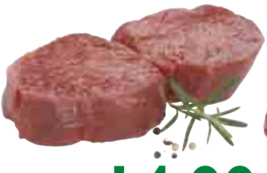
Falsches Filet vom Bug 14.99 l kg