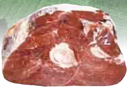
Rinder-Keule 13.99 l kg