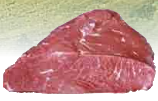
Tafelspitz 16.99 l kg