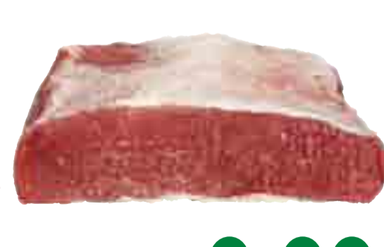
Rinder-Brust 9.99 l kg