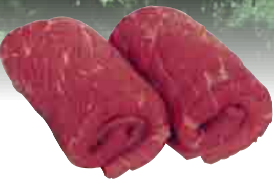
Rinder-Rouladen 15.99 l kg