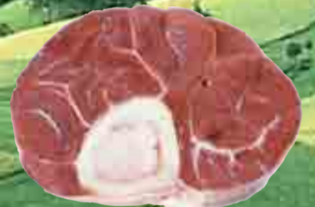
Rinder-Beinscheiben 9.99 l kg