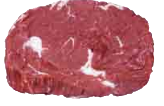
Entrecôte 23.99 l kg