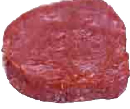
Rinder-Filets 39.99 l kg