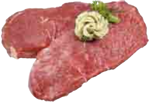
Rumpsteaks 27.99 l kg